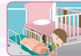
6. 踩到陪客床上的被子滑倒