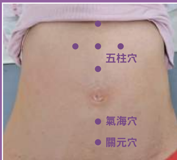
腹部貼灸常用穴位圖

其次，中醫灸療可以幫助化療後消化不良、食慾不振的患者調節腸胃功能。中醫認為，腸胃是人體的“根本”，中醫灸療可以刺激腸胃相關的穴位，促進腸胃蠕動，改善消化吸收功能，從而緩解消化不良、食慾不振等症狀，常用五柱穴。