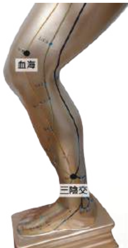
血海穴及三陰交穴位圖

三陰交位於大腿內側，從內踝骨向上數四指寬的地方。能調節婦科疾病、調和陰陽、舒解壓力。每日按摩三次，每次三分鐘。