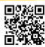
彰基官方粉絲專頁